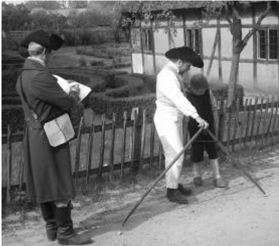
Abbildung 9: Berufstypische Fähigkeiten einüben: Streckenmessung des Geometers mit dem Feldzirkel (Freilichtmuseum Kiekeberg)

Wir meinen dagegen, daß man eine Tätigkeit, am besten einen Beruf, unter „historischen“ Bedingungen ausgeübt haben sollte, um glaubwürdig davon erzählen zu können (Siehe Abbildung 9). Bei der Vermittlung materieller Kultur sind handwerkliche und berufstypische Fähigkeiten und Kenntnisse absolut unverzichtbar. Das Produkt der Arbeit sollte in etwa der Qualität unter historischen Bedingungen entsprechen: Ein Weber webt nicht nur bißchen, sondern hat mindestens einige Ellen Leinen akzeptabler Qualität gewebt... Es wird also gefordert, daß der Interpret sein „modernes“ Wissen ausblenden sollte, und sich in die historischen Fertigkeiten und Bedingungen hineindenken muß.