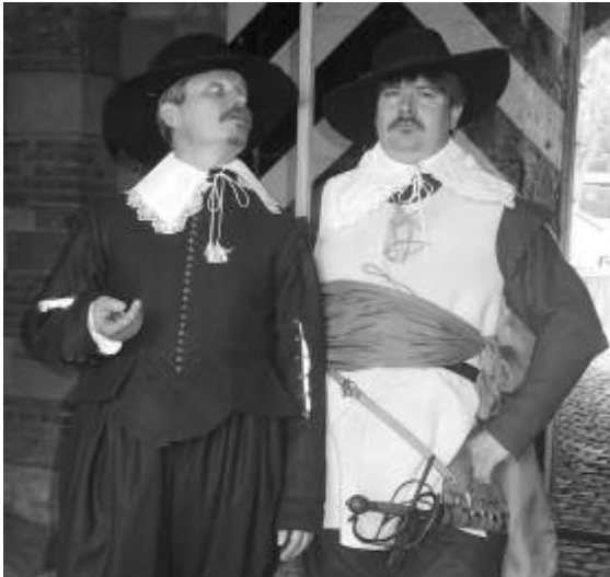
Abbildung 6: Beispiel für eine gespielte Szene nach Drehbuch, Bestechung eines niederländischen Offiziers durch den Secretarius vom Rat der Stadt nach der Eroberung Wesels 1629 (Preußenmuseum Wesel)