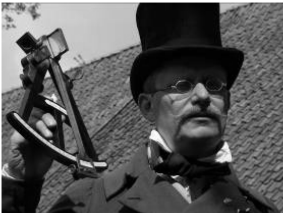
Abbildung 4: Beispiel für Technikgeschichte als Demonstration eines Zeitzeugen: ein Geometer Anno 1820 erklärt, wie mit dem Oktanten Höhen und horizontale Winkel zu Lande vermessen werden können. Hier können Zusammenhänge erklärt werden, die sich aus einer reinen Vitrinenpräsentation oder Katalog nicht ergeben (Hamalandmuseum Vreden)