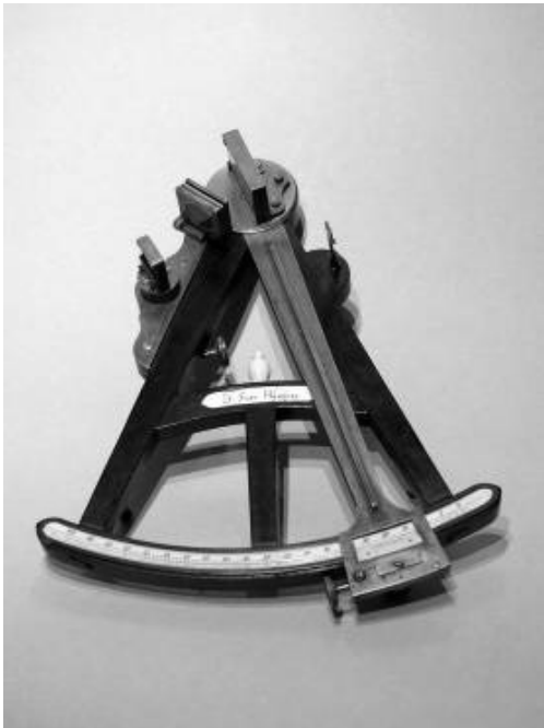
Abbildung 3: Beispiel für eine museale Präsentation: Oktant aus der 1. Hälfte des 19. Jahrhunderts. Die Funktionsweise und die Verwendung bei der Navigation müssen auf zusätzlichen Schautafeln erklärt werden.

der Vermittlung, nicht eine perfekt inszenierte Bühnenszene.