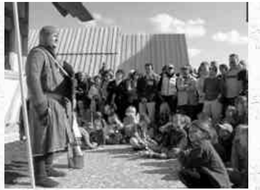
Abbildung 2: Demonstration in der dritten Person zur Bewaffnung und Ausrüstung eines Ministerialen aus dem Hochmittelalter (Vollrekonstruktion, Museum Burg Kanzach)

Bei der Körpersprache verhält es sich ähnlich: hier gilt es, die vielen Modernismen bei der Haltung abzustreifen und vor allem die Standesunterschiede sichtbar zu machen. Die Rekonstruktion ist immer stark spekulativ, kann aber durch Recherchen in Benimmbüchern, Sprachlehrbüchern und zeitgenössischen Abbildungen plausibel gemacht werden. Wenn Körpersprache und historische Sprache realistisch wirken, spiegelt es sich sofort in den Reaktionen Besucher wieder, die sofort für einen Interpreten Partei ergreifen oder das Auftreten von besseren Ständen als unverhältnismäßig arrogant empfinden.