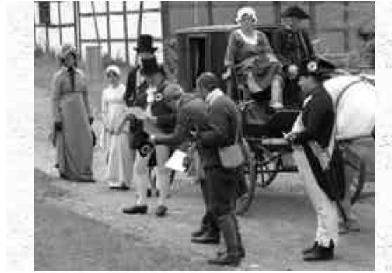
Abbildung 5: Komplettes Szenario mit ca. 30 Akteuren im spontanen Rollenspiel, hier die fiktive Huldigung des Maire (Bürgermeister) vor dem Landrat als Vertreter der neuen Obrigkeit, des Herzog von Berg, im Jahr 1806. Alten Höflichkeitsformen sind an der devoten Haltung und dem Kratzfuß des Maires besonders schön zu erkennen (Freilichtmuseum Kommern)