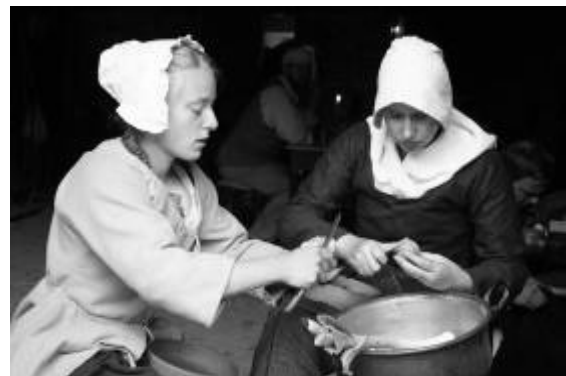
Abbildung 8: Selbsterklärendes Display ohne Erläuterung: Das Gesinde putzt das Gemüse (Freilichtmuseum Kommern)