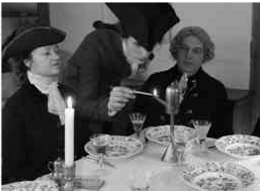
Abbildung 10: Rekonstruktion von bürgerlichen Tischsitten für die 2. Hälfte des 18. Jahrhunderts. Der Tisch ist mit rekonstruiertem Geschirr Besteck und Gläsern eingedeckt. Der Bediente entzündete mit dem Fidibus die Rüböllampe– gleich wird das Tischgebet gesprochen. Zuschauer können von der Tür oder dem Seitenraum zusehen und erhalten Erklärungen (Freilichtmuseum Kommern, © Kersten Kircher).

Alltags an (engl. Live-in Experiences), also z.B. die Belegung eines ganzen Hauses mit allen Aufgaben, wie sie vor 200 Jahren hätten anfallen können (Siehe Abbildung 10). Idealerweise lebt der Darsteller für 24 Stunden in der Umgebung. Im Gegensatz zur gehobenen Kultur ist jedoch die Rekonstruktion des Alltags in einem bäuerlichen oder bürgerlichen Haushalt eine besondere Herausforderung, weil sich wenige Bild- und Schriftquellen erhalten haben, und die Akteure sich auf einen völlig neuen Alltag einstellen müssen.